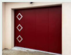
PORTES DE GARAGE