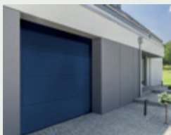
PORTES DE GARAGE